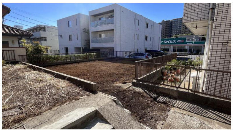
通路奥は整形地です。