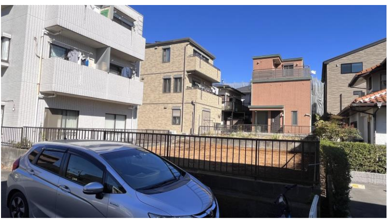
南側隣地空地あり！日当たり良好